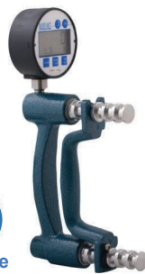
12-0247 Digitale Hydraulik Handdynamometer