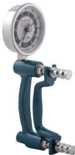
12-0243 Hi-Res™ Hydraulik Handdynamometer