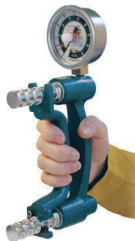
12-0240 Standard -Hydraulikhand Dynamometer