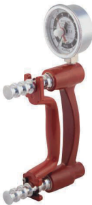
12-0241 LITE™ -Hydraulik Handdynamometer