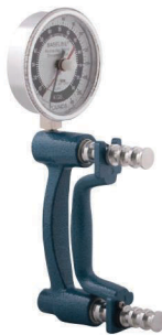
12-0246 ER™ -Hydraulik Handdynamometer