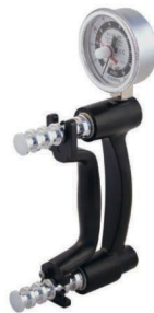
12-0221 HD™ -Hydraulik Handdynamometer