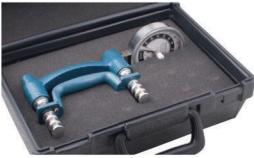
ER™ Hi-Res™ Handdynamometer