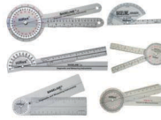
6-teiliges HiRes™ Goniometerset aus Kunststoff