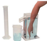
volumetrisches Odem der Hand Lehren