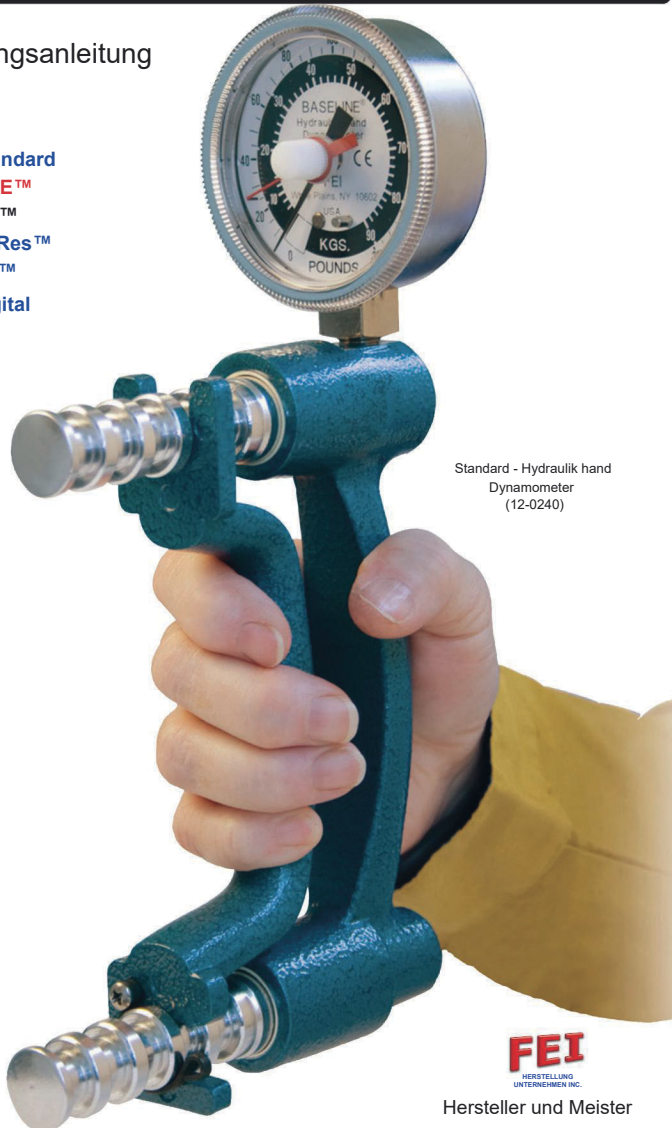
Standard - Hydraulik hand Dynamometer (12-0240)