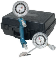
3-teiliges HiRes™ Hand-Evaluierungsset

die umfassendste Reihe von Instrumenten für den Physiotherapeuten