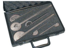
6-teiliges Goniometer-Set aus Edelstahl