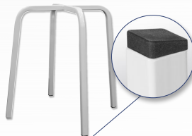
Gestell Exklusiv Vierkantrohr