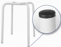
Gestell Standard Rundrohr