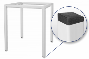
Gestell Standard Vierkantrohr