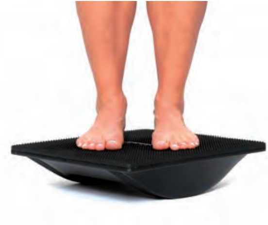
Diagonale Ebene (Füße schräg zur Kipprichtung)

Der Kipp-/Beugewinkel des Kreisels liegt bei 22°, der des Kippbretts bei 30°.