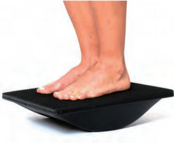
Sagitalebene (Füße in Kipprichtung)